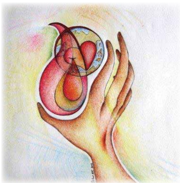
logo Vrhovnog sabora 2011.

Biramo život njegujući stavove pomirenja, radosti i nade.