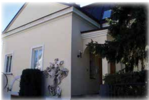
regionalna kuća Klanjateljica Krvi Kristove (Zagreb, Tuškanac 56)

Biramo život njegujući stavove pomirenja, radosti i nade.