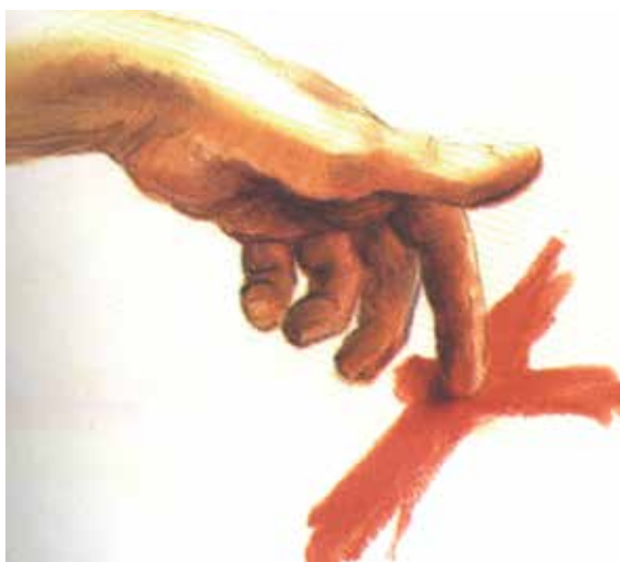
Mate Ljubičić: biljeg krvi

Biramo život njegujući stavove pomirenja, radosti i nade.